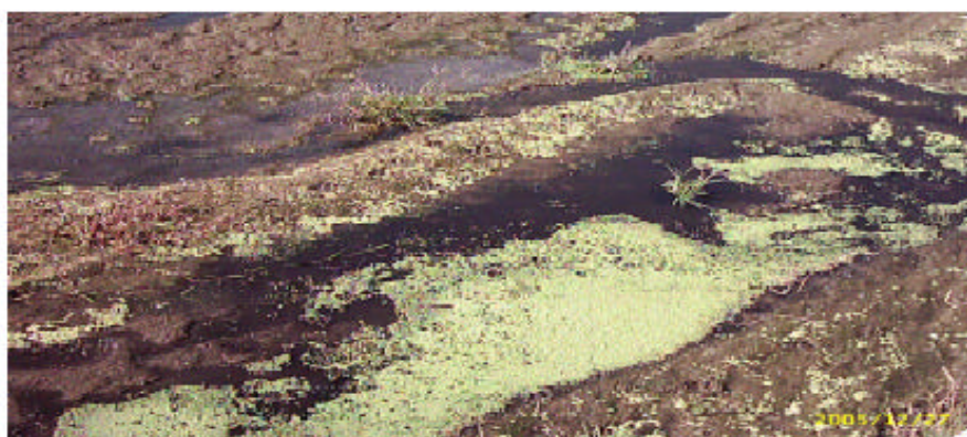
水質優氧化後的結果，水面上覆蓋了一層綠色植物，導致水的涵養量減少，魚兒便無法繼續生存。

若政府能提撥相當的補助，設置廢水處理集中場，嚴格管制廢水的排放標準，並輔導農民相關的知識做到維護環境人人有責，在大家建立好環保基礎後，那們我們的子孫在未來，能就擁有乾淨的成長空間。