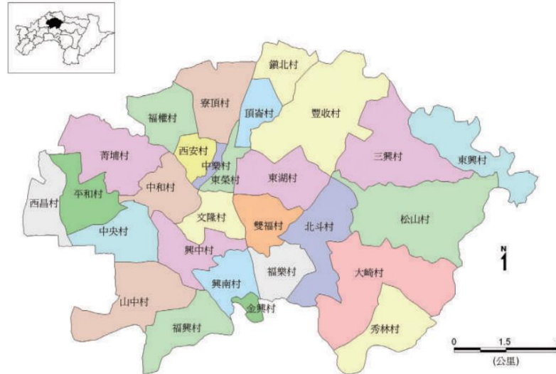
圖 2-1：民雄鄉行政區域圖