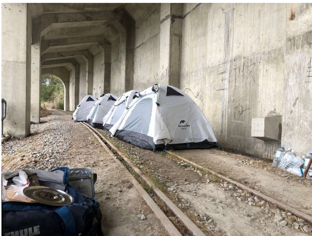
圖 4 紮營地點