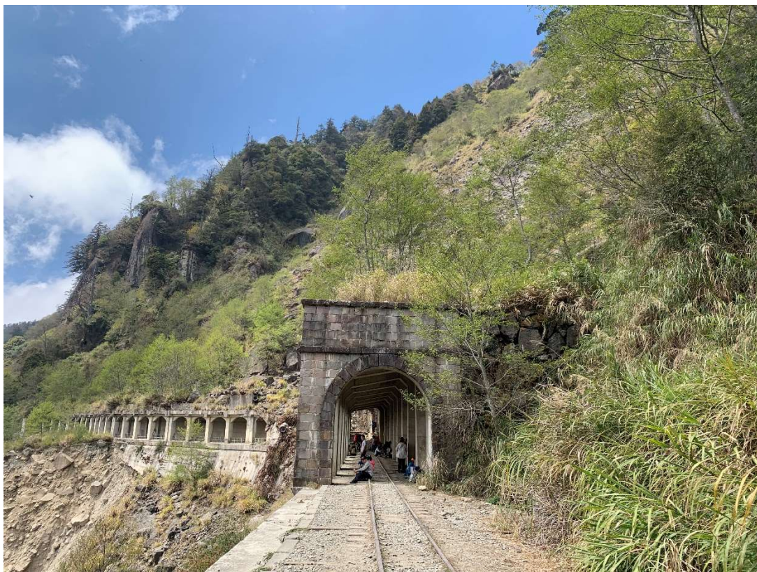
圖 3 教育介入及問卷施測地點