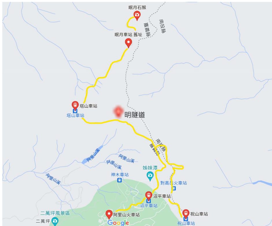
圖 2 研究場域地理位置圖