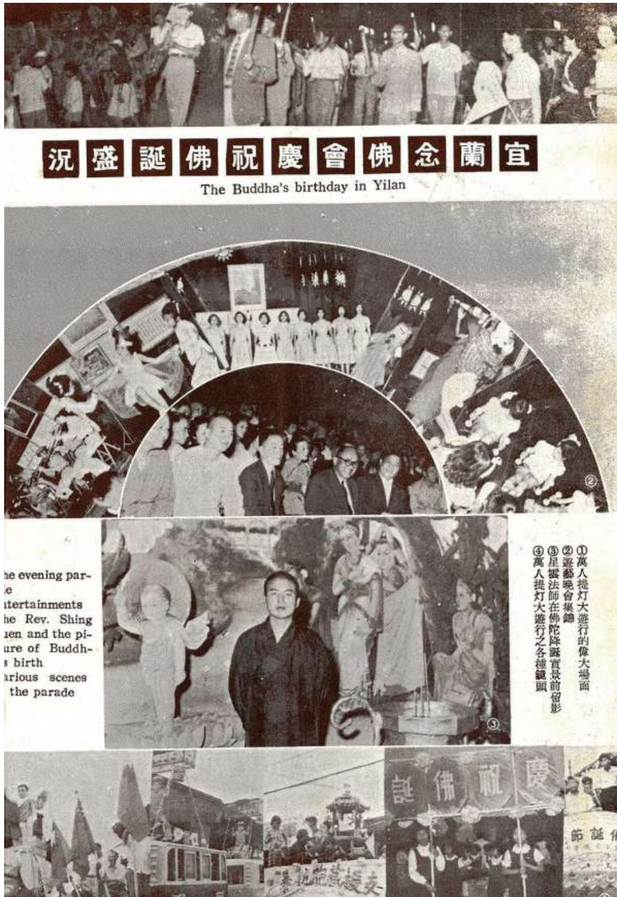
1959年6月1日《今日佛教》第26期登載林立拍攝「今日佛教畫頁：宜蘭念佛會慶祝佛誕盛況」可以見到當時提燈大遊行、遊藝晚會等活動實踐的情形。