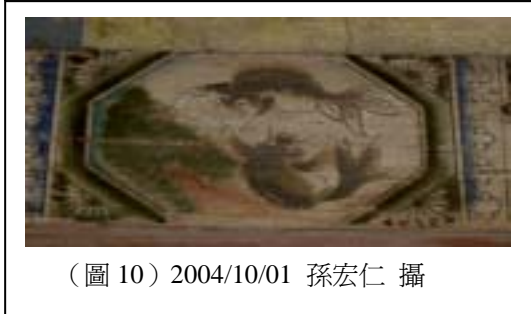
(圖 10) 2004/10/01