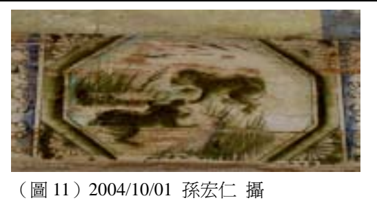
(圖 11) 2004/10/01