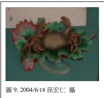
圖 9. 2004/6/18