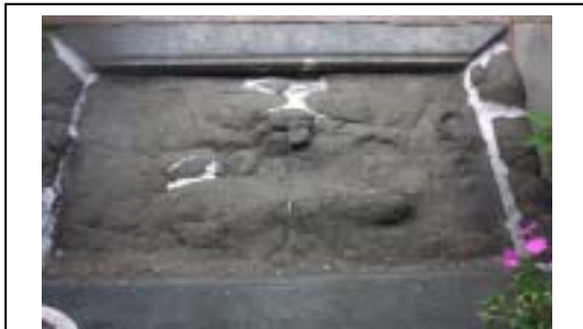
圖 1. 2004/6/30