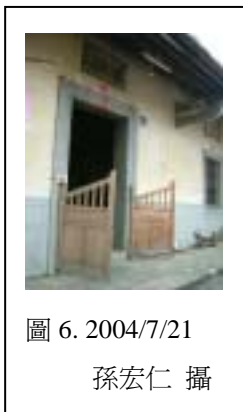
圖 6. 2004/7/21