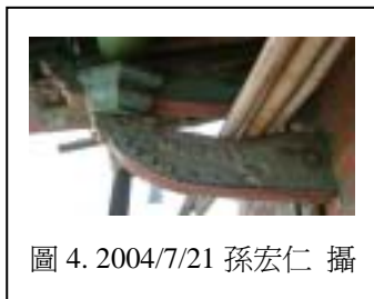
圖 4. 2004/7/21