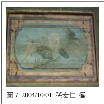
圖 7. 2004/10/01