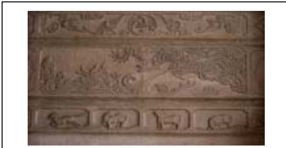
圖 2. 2002/10/5