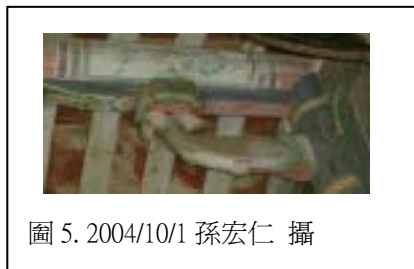
圖 5. 2004/10/1