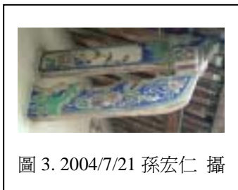
圖 3. 2004/7/21