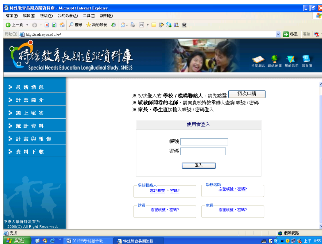
圖9 特殊教育長期追蹤資料庫