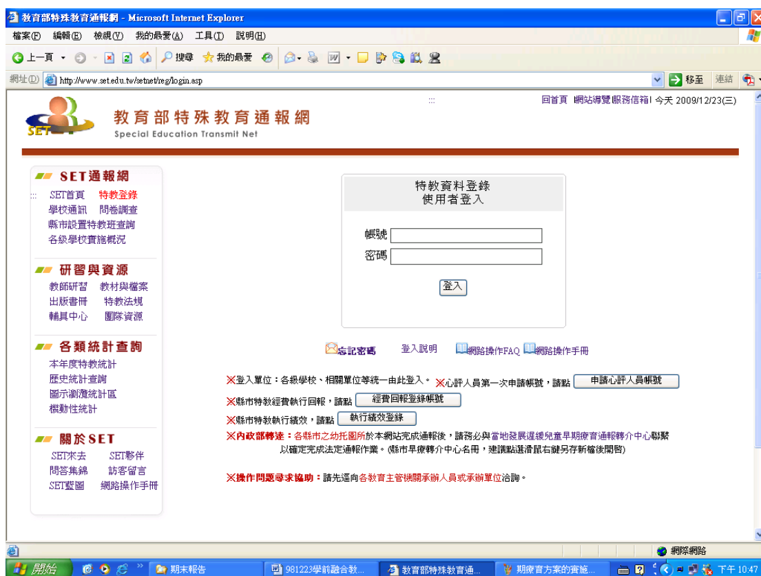
圖 3 教育部特殊教育通報網首頁