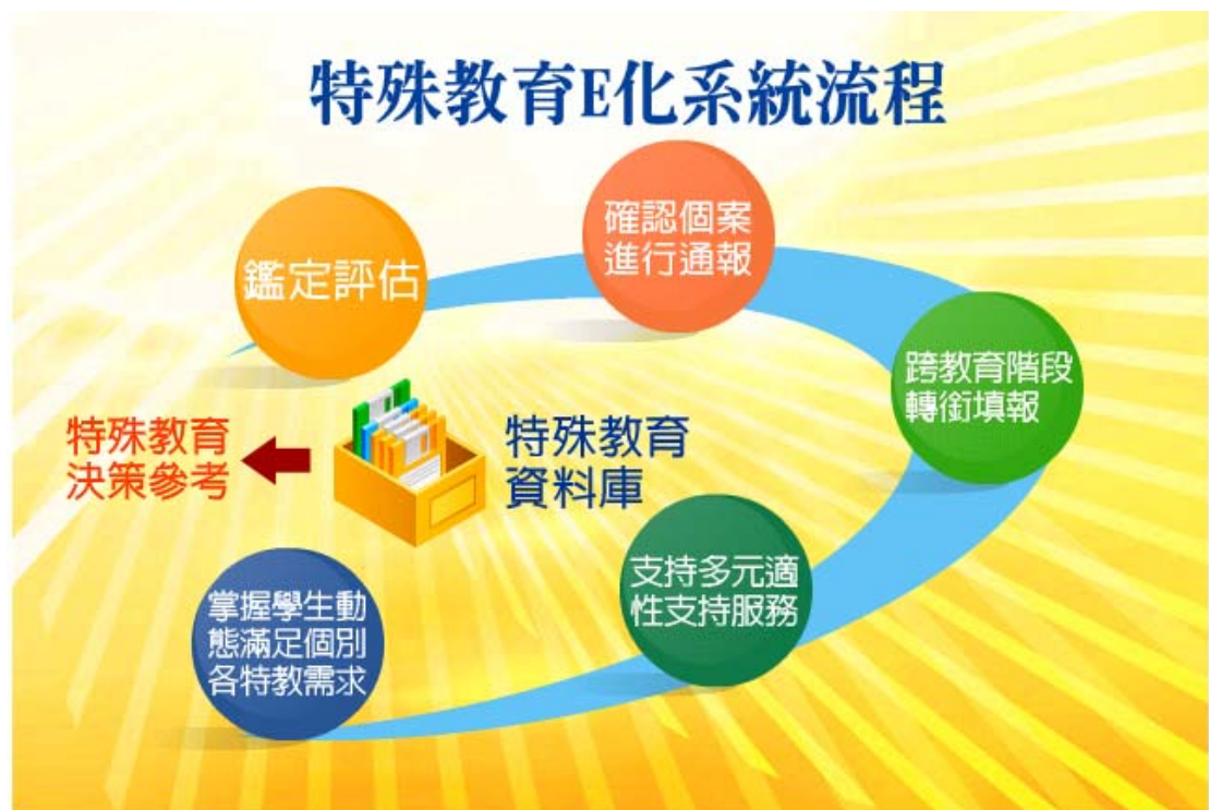
圖 2 特殊教育 E 化系統流程

因此，本文針對IEP的擬定與執行，及其所產生之專業團隊各自為政的問題提出探討，並針對實務問題提供改進之道，希望能對參與IEP擬定與執行之人員有所幫助。此外並配合特殊教育E化系統流程（如圖2），希望有助於提升專業團隊IEP運作的邊際效用（維基百科全書，2009）與執行效度，以期符合「特殊教育法修正草案」（教育部，2009）第一條：「為使身心障礙及資賦優異之國民，均有接受適性教育之權利，充分發展身心潛能，培養健全人格，增進服務社會能力，特制定本法」之精神。