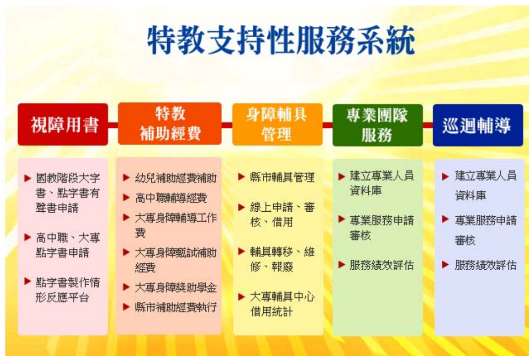
圖 6 特教支持性服務系統