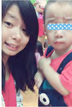
圖 1 國慶日的分享紀錄

P.s這是一個非常愛皺眉頭的兩歲班小孩， 皮膚白嫩嫩的，老師們都叫他豆花啦，哈哈