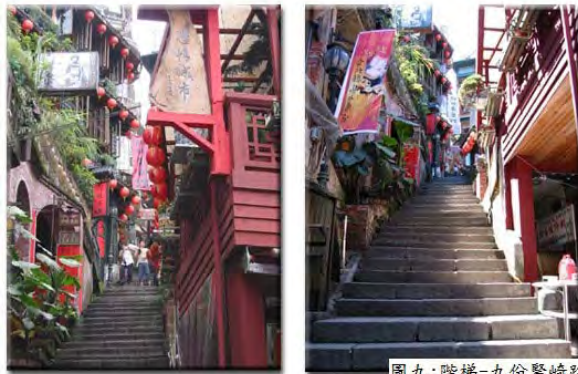
圖九:階梯-九份豎崎路