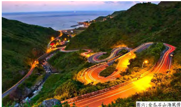
圖六：金瓜石山海風情

金水公路(指金瓜石到水湳洞)原屬載運鑛石的產業道路，金鑛停產之後，道路成為濱海公路通往金瓜石的次要聯絡道路，其路線是由金瓜石的新山里通往三安社區，在長仁橋附近與金水公路相接。金水公路沿途蜿蜒曲折，九彎十八拐，由於道路一邊是繞著山丘盤旋、另一邊卻是緊緊捱著山谷，迴頭彎處的道路更是呈現 360 的大轉彎，因此是一條難度與危險性高的道路，不過觀光客不論是由濱海公路水湳洞附近順坡而上，或由新山里通往水湳洞，亦皆可將金瓜石聚落的全景一覽無遺。