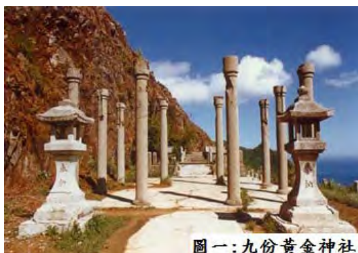
圖一：九份黃金神社

九份的黃金神社（又名山神社），昭和 8 年（西元 1933 年）為日本鑛業株式會社接管金瓜石鑛山後，在九份四平巷下方三百公尺山腰矽化岩的山壁旁所建造的一座石砌平台，上興建神社，主祀「大國主命、金山彥命與金山姬命」並每年元旦舉行一次大拜拜，在日本國慶時亦舉行參拜會。