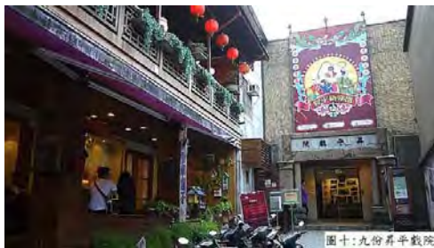
圖十:九份昇平戲院

九份昇平戲院位於輕便路與豎崎路交接之間，原建立於民國 3 年(西元 1914 年)，當時僅是木造戲台，座落於基山街市場附近，名「昇平座」。民國 22 年才遷建現址，一樓是石造，二樓是木造，到了民國 40 年改造成今日鋼筋混泥土的模樣。昇平戲院是全台灣第一家日據時期的戲院，一天演兩場，九份鑛山沒落後，因娛樂事業也大受衝擊，於民國 75 年停止營業。昇平戲院作為第一家日劇時期的戲院，如今雖已殘破，但仍是九份歷史地景中的重要象徵。