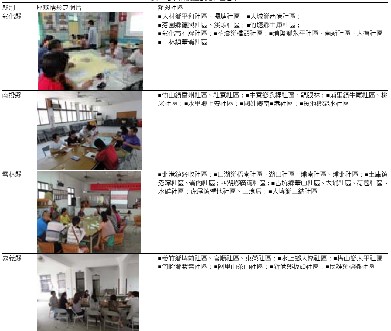
表2 參與焦點座談之社區名單