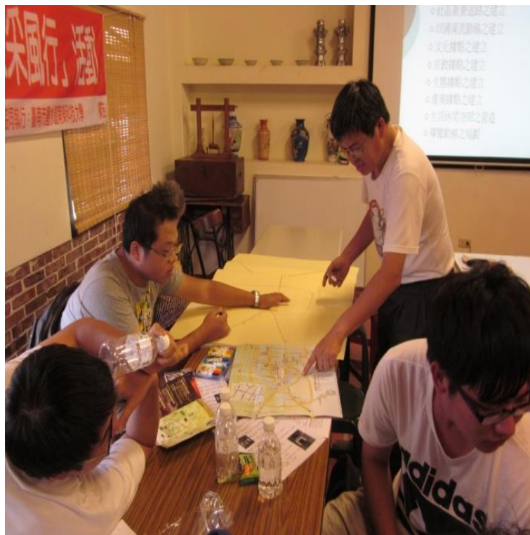
圖 3. 話社區·畫社區

結合課程於場域，在橋南老街實施「話社區·畫社區」活動，由任課教師等帶著進行場域的活化社區活動，這門課，吸引了不少阿公、阿嬤進來貢獻自己的長處。而本圖已非一般的地圖了，其中包含著月津古鎮新八景的所在地等。相關活動照片與活動花絮如圖 3，當地的阿嬤也來學習了，我們不知道如何稱呼她的姓名，但是，我們知道一件事，那就是當地的居民會與我們分享他們”原本就有”的氛圍，只是遺失罷了。路畫歪了，連阿公都進來指指點點了。當地人就是當地人，一看就知道哪邊的路太寬了、轉彎的坡度、路的長短，完全掌握得很好。