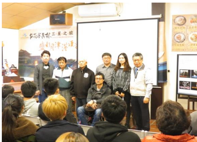
圖 6. 社區微電影創作與耆老留影