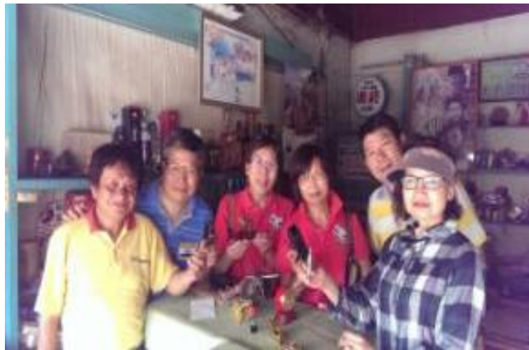
圖 2. 橋南老街大和行柑仔店打火機達人

台南市鹽水區古稱「月津港」，早期兼具河港與海港雙重角色，舟楫往返絡繹不絕，是台南市建置最古老的城鎮，亦是古諸羅縣治及台南府間交通要津。開發至今已逾三百餘年，有豐富的人文資產，歷史悠久的古廟，懷舊的老街巷弄，是人文薈萃的古鎮。後因為失去交通及商業契機，逐漸褪去光彩，熱鬧的月津港逐漸沒落，昔日風光不再，但「塞翁失馬，焉知非福」，失去商業蓬勃發展及大量的土地開發，純樸的民風及古老建築等依舊保存。走入橋南老街與社區耆老對話，「古鎮軼事話橋南風華」、「南瀛一街尋舊夢」，進一步橋南老街參觀體驗及拜訪老街柑仔店（大和行）等。安排月津古文化體驗教學活動，由任課教師結合社區耆老等帶著進行場域的巡禮，相關活動花絮如圖 2 打火機達人，自年輕時就開始蒐集各式各樣的打火機，琳瑯滿目，美不勝收，實在是增長見聞。