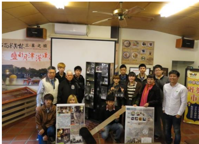
圖 5. 「設計美學再造鐵的記憶」的成果合影

智慧服務蜂炮鎮 再現宜居新月津成果發表會的教育目標為『創意價值』，是以『人本思考』為核心，確實落實訓練學生將「創意」轉為「創新」，將「創新」轉成「創業」。智慧服務蜂炮鎮再現宜居新月津成果發表會內容包括：永成戲院文創展示櫃設計、「泉利號」百年老打鐵舖再造鐵的記憶、老街有情味—大和行文創展示櫃設計、以及在地文化的微電影創作展。圖 5 是「設計美學再造鐵的記憶」的成果合影，圖 6 則是「在地文化的微電影創作展」會後與在地耆老的留影。