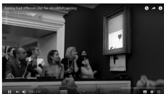
圖片來源：USA TODAY, Banksy had different plan for shredded painting -- A "director's cut" released by Banksy shows what the iconic artist intended for the "Girl with Balloon" painting that self-destructed at auction. https://www.youtube.com/watch?v=t093FzCkas0 (拜訪日期：2018年10月20日)

Banksy將其畫作在拍賣會落槌後當場銷毀一半，可能涉及幾個民法議題。首先，就買賣標的物而言，交易的標的是畫作還是裝置藝術？甚至行為藝術？拍賣品圖錄的作品標示是否為複合媒材，將是重要參考；其次，因為拍賣官拍出的作品在落槌後被當場銷毀一半，導致原作未能交付給拍定人，將使出賣人陷於給付不能；又若藝術家擅自將原作銷毀一半，也可能構成對所有權人的侵權行為；再者，據報導「重生後」