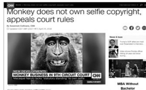
圖片來源： https://edition.cnn.com/2018/04/24/us/monkey-selfie-peta-appeal/index.html (拜訪日期：2018年04月24日)

其實，藝術的價值，隨著創作完成而客觀存在，本不需法律予以肯定或證明。然而，為了促進藝術文化的發展，一方面我們要維護藝術家的創作動能，另一方面又要兼顧藝術的普及與公眾利益，現實上，就有透過法律來鞏固、發揚藝術價值的必要。然而，法律的制定與適用講求一貫的經驗脈絡、邏輯性、穩定性與可預測性；相對的，藝術領域則強調展現自我個性、獨特性、發揮巧思、展現創意。如能使法律與藝術相互理解並從中取得平衡，或許將更能透過法律來維護、確立藝術的價值。